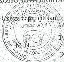
Схема сертификации – Зс по ГОСТ Р 53603-2009.